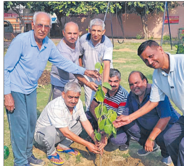
बहादुरगढ़। सेक्टर-6 पार्क में पौधे लगाते वरिष्ठ नागरिक।