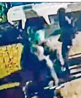
रेवाड़ी। सीसीटीवी फुटेज में नजर आ रहे कच्चा-बनियान पहने चोर।