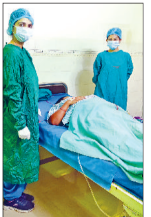
इज्जर। आप्रेशन के बाद जच्चा-बच्चा के साथ उपस्थित सिजेरियन टीम।

नागरिक अस्पताल बेरी में नई शुरुआत करते सोमवार को आपातकालीन सिजेरियन सेक्शन के अंतर्गत सफल आप्रेशन किया गया। जच्चा एवं बच्चा स्वस्थ हैं। इस सफलता पर सीएमओ डॉक्टर जयमाला ने अस्पताल स्टाफ एवं सिजेरियन टीम को बधाई देते हुए कहा कि यह शुरुआत बेरी एवं आसपास के क्षेत्र की महिलाओं के लिए बहुत ही फायदेमंद साबित होगी।