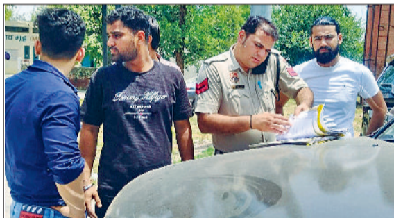
झज्जर। नागरिक अस्पताल परिसर में पोस्टमार्टम के लिए कागजी करते हुए पुलिसकर्मी।