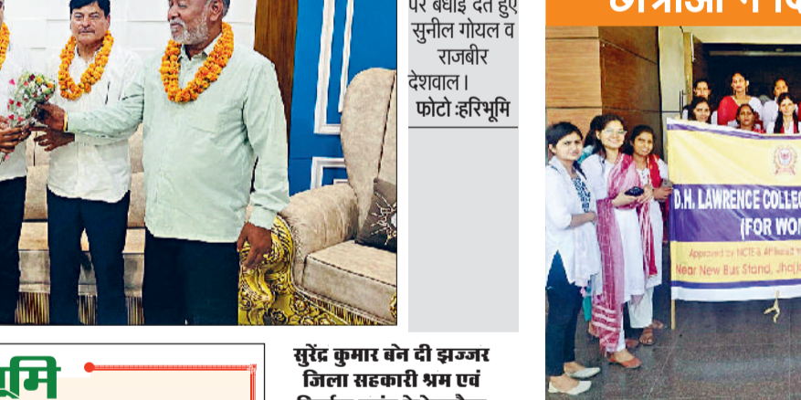
झज्जर। कार्यक्रम में भागीदारी करने वाले डीएच लॉरेंस कॉलेज की छात्राएं।