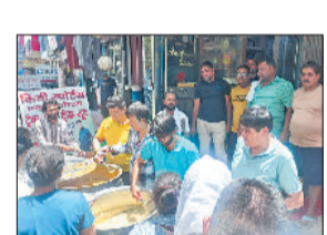
बहादुरगढ़। कढ़ी चावल का प्रसाद वितरित करते हुए कुमनदर।

उत्तर हरियाणा बिजली वितरण निगम बहादुरगढ़ डिवीजन के उपभोक्ताओं की बिजली और बिल संबंधी समस्याओं के समाधान के लिए मंगलवार 10 जून को यूएचबीवीएन कार्यालय में बिजली अदालत लगेगी। मंगलवार की सुबह 11 बजे से दोपहर 1 बजे तक बिजली अदालत लगाकर उपभोक्ताओं की शिकायतों का निदान किया जाएगा। उपभोक्ताओं की बिजली और बिल संबंधी समस्याओं (बिजली चोरी को छोड़कर) मामलों की सुनवाई होगी।