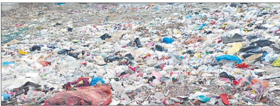
बहादुरगढ़। कचरे में प्लास्टिक की भरमार।

दरअसल, बीते दिनों ही बहादुरगढ़ में प्रदूषण नियंत्रण बोर्ड की ओर पॉलीथिन बेचने के मामले में कार्रवाई की गई थी। इस दौरान काफी मात्रा में पॉलीथिन बरामद हुई और दुकानदारों पर 80 हजार रुपये से अधिक का जुर्माना लगाया गया। इससे पहले भी नगर परिषद की ओर से शहर में कई बार इस तरह की कार्रवाई की जा चुकी है। काफी भारी भरकम चालान किए हैं। इस