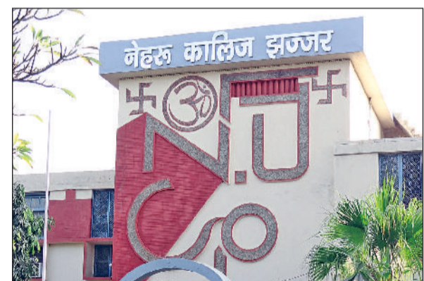
झज्जर। राजकीय स्नातकोत्तर नेहरू महाविद्यालय भवन का फाईल फोटो।