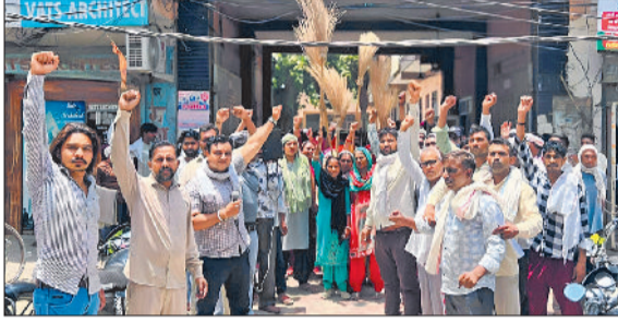
बहादुरगढ़। नगर परिषद के गेट से झंडू प्रदर्शन शुरू करते कर्मचारी।

दरअसल, ठेकेदार के अधीन कार्यरत इन सफाई कर्मचारियों का तीन महीने का वेतन बकाया है। इसके अलावा ये साप्ताहिक अवकाश की भी मांग उठा रहे हैं। मांग पूरी न होने के चलते गत तीन जून को इन्होंने हड़ताल शुरू की थी, जो अब तक जारी है। हड़ताल के कारण शहर में सफाई व्यवस्था बिलकुल चौपट हो चुकी है। शहर के हालात बुरे हैं। बीमारियां फैलने की आशंका बनी हुई है। सोमवार को भी हड़ताली कर्मचारियों ने नगर परिषद के गेट पर धरना दिया। इसके अलावा, रोहतक-दिल्ली रोड पर प्रदर्शन किया। प्रदर्शन के दौरान