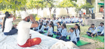
बहादुरगढ़। सोमवार को आईटीआई में योगसभ्यता करते प्रशिक्षु।