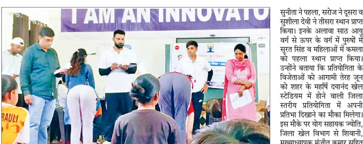
झज्जर। योग प्रतियोगिता के दौरान मौजूद प्रतिभागी एवं योग सहायक।

अंतर राष्ट्रीय योग दिवस की तैयारियों को लेकर सोमवार को आयुष विभाग द्वारा पीएमश्री राजकीय वरिष्ठ माध्यमिक विद्यालय माछरौली में योग प्रतियोगिता का आयोजन किया गया। प्रतियोगिता के दौरान योग